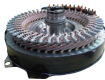
高電圧用平角巻線