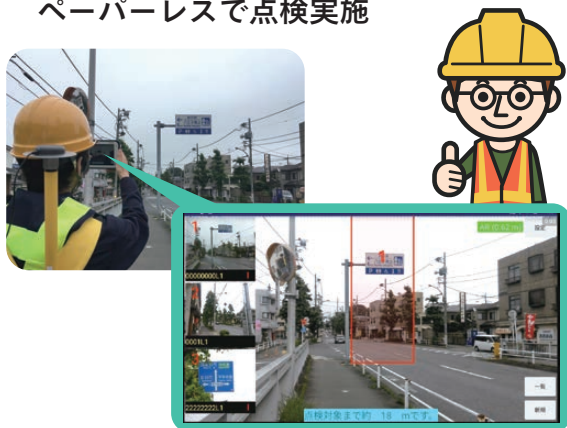
タブレットのAR画面例